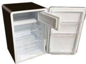
Medidas en mm.